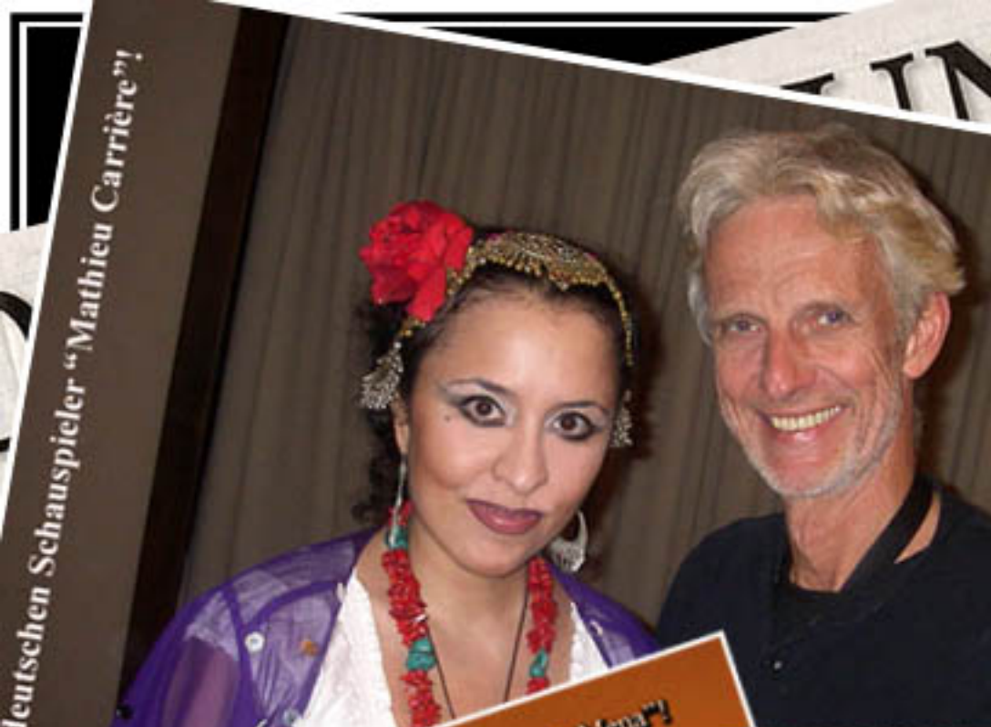
... mit dem deutschen Schauspieler "Mathieu Carrière"!