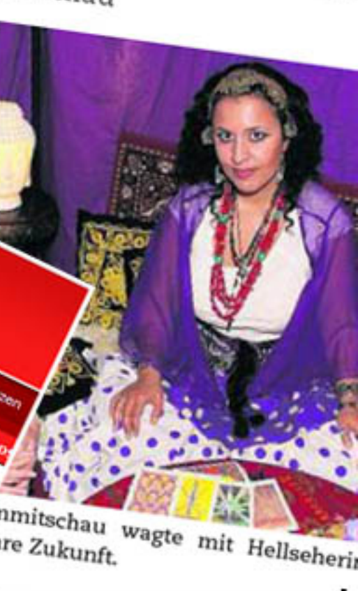
... Mittagschau wagte mit Hellschierin ihre Zukunft.