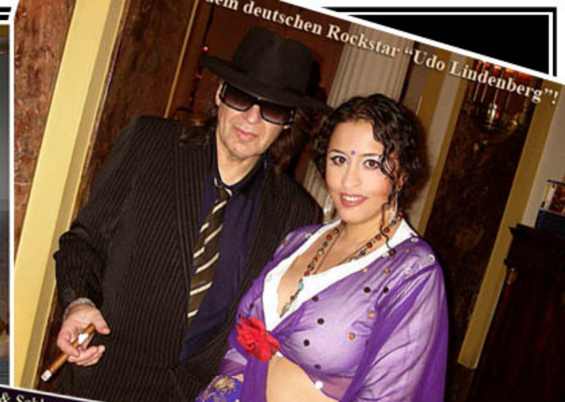
... mit dem deutschen Rockstar "Udo Lindenberg"!