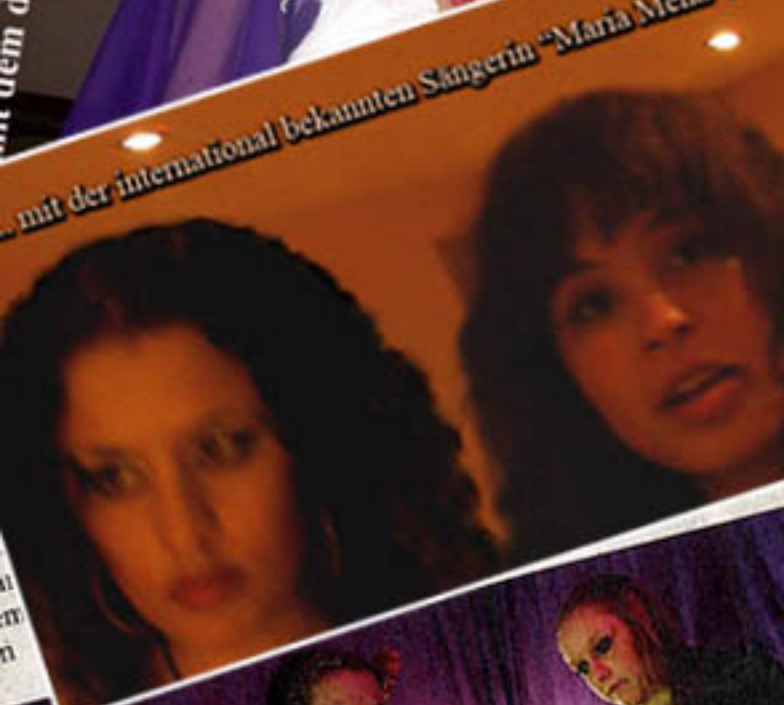
... mit der international bekannten Sängerin "María Mena"!